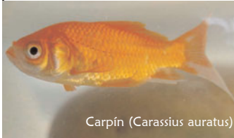
Carpín ( Carassius auratus )

S eguro que alguno de vosotros tiene un pez en casa. ¿Os acordáis de sus cuidados? Bueno, pues nosotros os los vamos a recordar: